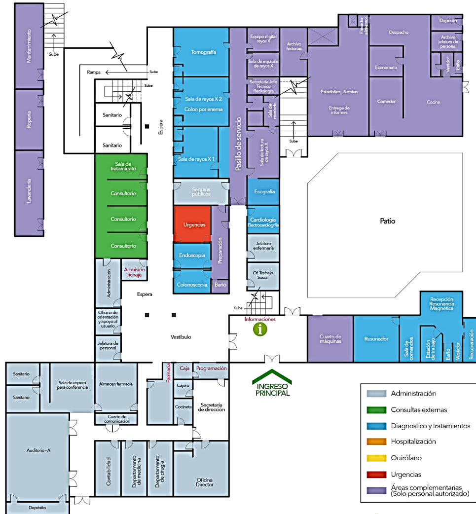
Gráfico 3. Distribución del hospital, Planta Baja