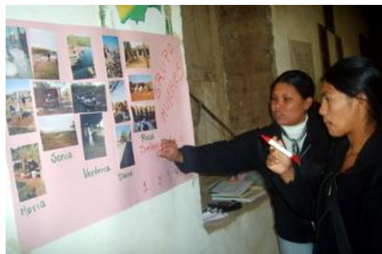
Figura 14. Taller de Reflexión - Plenaria Urubichá, Santa Cruz.

Una parte importante también de este taller fue el registro fotográfico de cada participante, incluyendo sus datos, especialmente de aquellos cuyas fotos fueron seleccionadas para las exhibiciones municipales y departamentales, por ser los autores de las mismas.