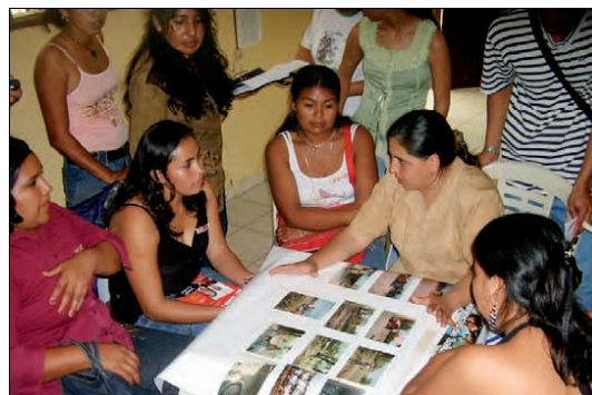
Figura 12. Taller de reflexión – Diálogo grupal Pailón, Santa Cruz.

Finalmente, los grupos conformados compartieron en plenaria las fotografías que han priorizado en relación a la situación de la salud de su municipio. Para ello, el grupo, con la ayuda del facilitador o facilitadora, reflexionó en torno a la pregunta: ¿Cuáles fotografías representan, muestran o expresan mejor la situación de la salud en las comunidades de nuestro municipio y por qué?