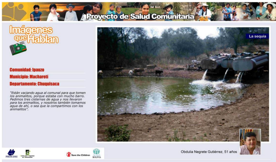
Figura 29. Una de las fotografías priorizadas sobre saneamiento básico .