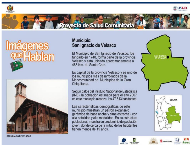
Figura 16. Información general del municipio correspondiente y de su situación de salud.