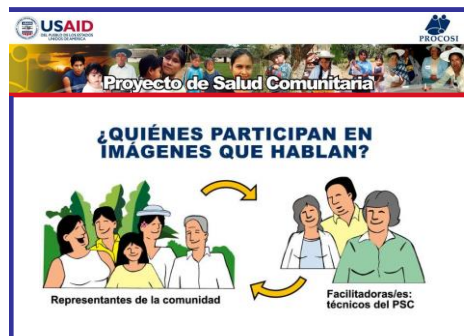
Figura 64. ¿Quiénes participan en Imágenes que Hablan?