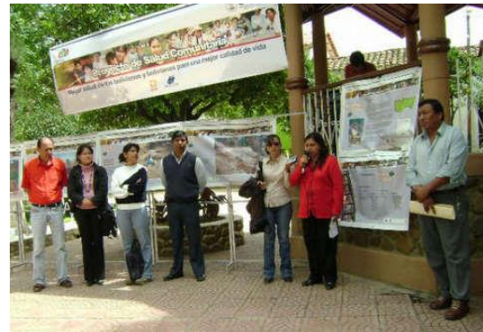
Figura 43. Exhibición municipal. Uriondo, Tarija.

A nivel departamental, se realizó una selección de las fotografías priorizadas en los municipios, tomando en cuenta aspectos de representación temática, intergeneracional e intergenérica, con el propósito de presentar también los resultados ante autoridades del ámbito nacional en diferentes espacios durante la implementación del Proyecto de Salud Comunitaria.