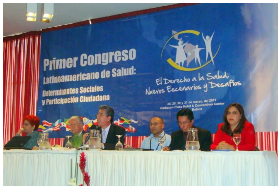
Figuras 56 y 57. Primer Congreso Latinoamericano de Salud: Determinantes Sociales y Participación Ciudadana. La Paz, marzo de 2011.

En las Figuras 54 y 55 se puede apreciar la presentación de los resultados y del autodiagnóstico y de la metodología, realizados con el propósito de sensibilizar a los representantes de las instituciones del Estado y de las organizaciones que trabajan en mejoramiento de viviendas, Chagas y saneamiento básico.