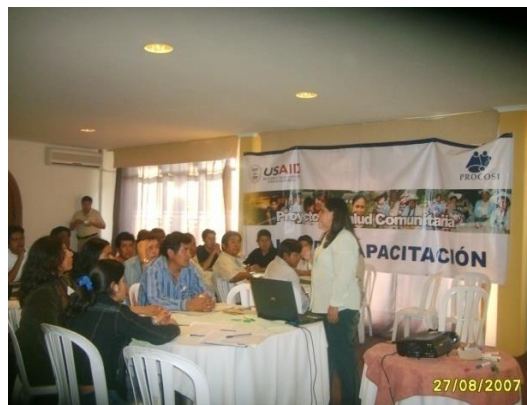
Figuras 1 y 2. Taller de capacitación sobre la metodología, Santa Cruz.

En el proceso de capacitación se puso especial énfasis en la filosofía que sustentaba la metodología y que básicamente tenía que ver con el respeto, el reconocimiento y la valoración de los puntos de vista de los participantes del autodiagnóstico, por tanto tenía que quedar fuera cualquier intento de sesgar o direccionar la mirada comunitaria hacia otros objetivos.