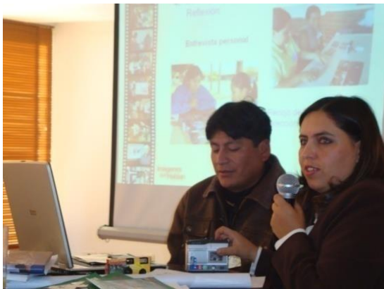
Figura 58. Capacitación a técnicos de la organización Child Fund en el desarrollo de la metodología.

resultados. En ese sentido, se compartió la experiencia con estudiantes de postgrado de Salud Pública de la Facultad de Medicina con técnicos de JICA y con otras organizaciones de la Red PROCOSI, interesadas en aplicar Imágenes que Hablan en sus proyectos, tal es el caso de Project Concern International (PCI) y Child Fund, cuyos procesos están en curso.