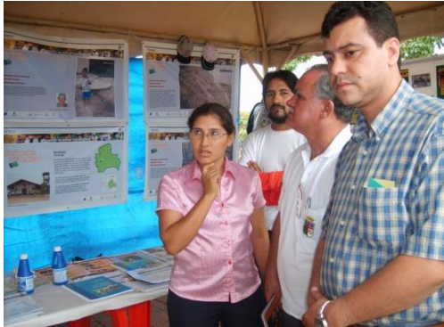
Figura 22. Exhibición municipal. Saavedra – Santa Cruz