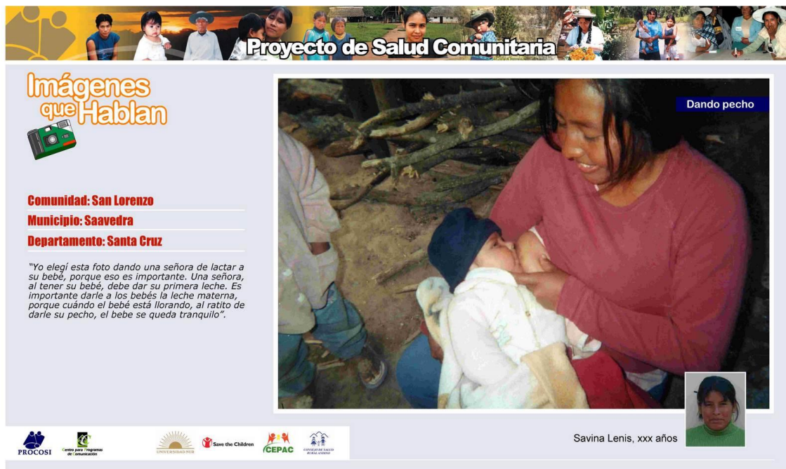
Figura 35. Una de las fotografías priorizadas sobre alimentación y nutrición.