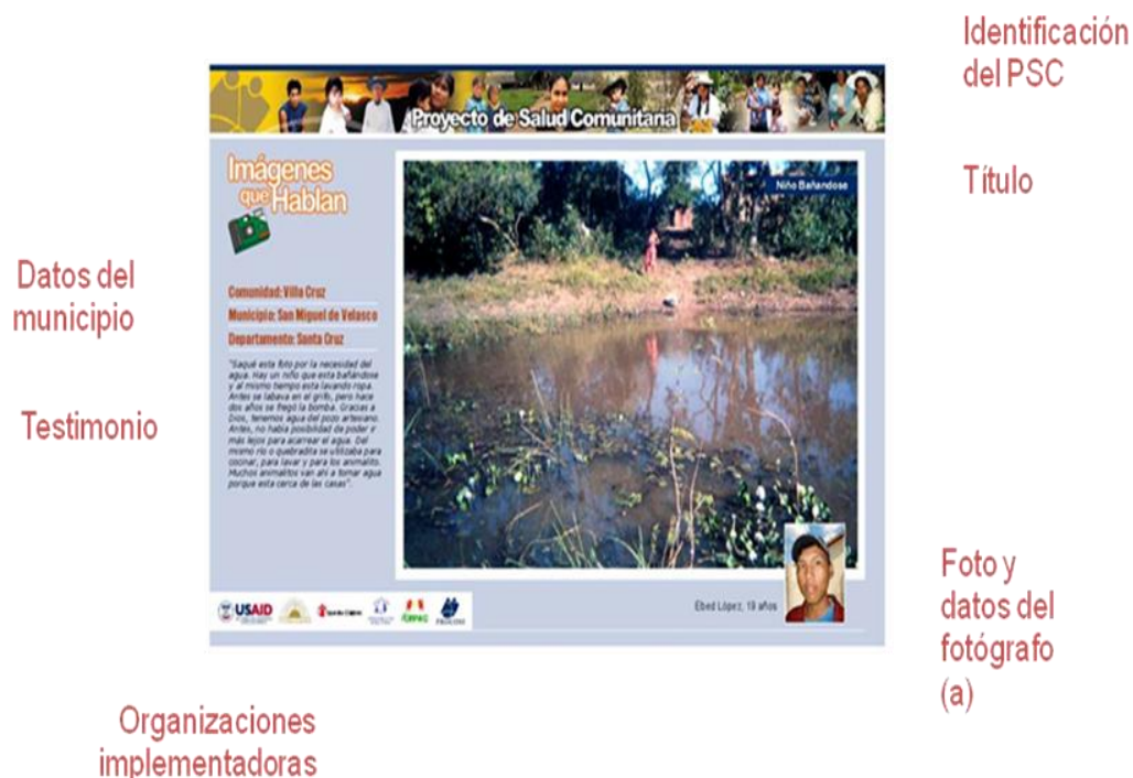
Figura 15. Características diseño fotografías priorizadas

Como se puede apreciar en la Figura 15, cada fotografía incluyó el testimonio y los datos tanto del fotógrafo/a, como del municipio y de las organizaciones implementadoras a nivel local. Adicionalmente, para cada municipio se produjeron 2 banners con la siguiente información: