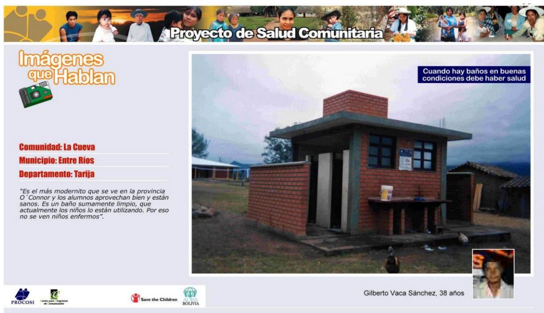
Figura 31. Una de las fotografías priorizadas sobre medio ambiente