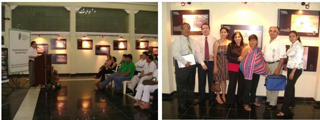
Figuras 50 y 51. Exhibición Gobierno Departamental de Santa Cruz , octubre de 2008.

Las Figuras 48 y 49 corresponden a la presentación de los resultados del autodiagnóstico realizada con el propósito de sensibilizar a los representantes de las instituciones del Estado y de las organizaciones que trabajan con el tema de Agua, considerando que éste es la determinante de la salud más importantes, desde la mirada comunitaria.