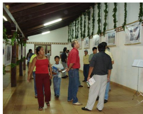
Figura 21. Exhibición municipal. San Ignacio de Velasco - Santa Cruz