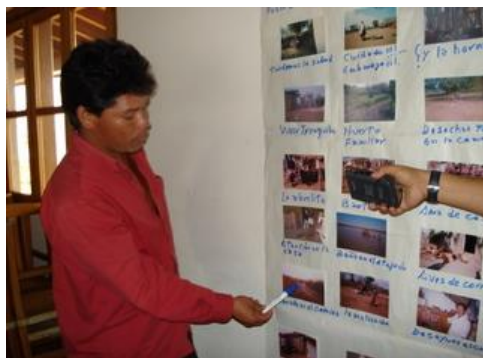
Figura 13. Taller de Reflexión - Plenaria San Ignacio de Velasco, Santa Cruz.