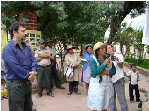
Figura 42. Exhibición municipal. Bermejo, Tarija.

El diálogo directo que tuvieron con sus autoridades los representantes de las comunidades, cuyas fotos fueron priorizadas, contribuyó a la sensibilización de los diversos actores clave de los municipios con el propósito de impulsar acciones a favor de la salud de las familias de las comunidades.