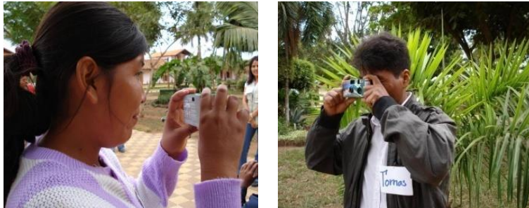
Figuras 5 y 6. Participantes del proceso San Ignacio de Velasco, Santa Cruz.

cada cámara tenía la capacidad de 27 fotos, un participante registró 13 fotografías y el otro, 14.