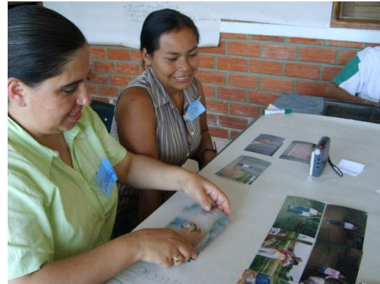
Figuras 7 y 8. Taller de Reflexión – Entrevista personal – Roboré, Beni