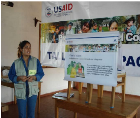
Figura 3. Taller de Encuentro San Ignacio de Velasco, Santa Cruz.

En el taller, a su vez, se brindó a los participantes la oportunidad de practicar con cámaras destinadas especialmente para ése propósito. Una vez concluida la parte explicativa y la práctica, se procedió a conformar parejas y se les hizo entrega de una cámara fotográfica a cada una de ellas. Entre ambos participantes podían sacar un total 27 fotografías. Posteriormente, en el mismo taller, se acordó un tiempo prudente para que puedan sacar las fotos en sus comunidades y se fijó una fecha para recoger las cámaras y concretar luego el revelado de las fotografías.