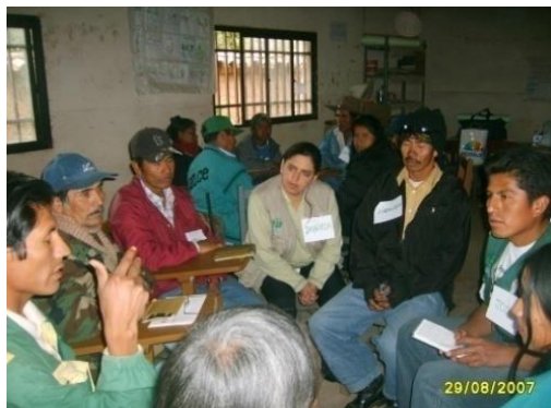
Figura 11. Taller de reflexión – Diálogo grupal. Huacaya, Chuquisaca.

A su vez, esas fotografías seleccionadas en cada grupo formarían parte del conjunto de fotografías priorizadas para la presentación de los resultados del proceso a través de exhibiciones a nivel municipal y departamental.