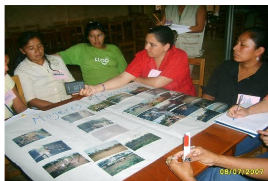
Figura 10. Taller de Reflexión - Diálogo Grupal San Miguel de Velasco, Santa Cruz.

A diferencia de las entrevistas individuales, en la sesión grupal, son muy importantes las opiniones de todas y todos, por lo que se recomendó también registrarlas para la sistematización final del proceso.