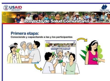
Figura 65. Primera etapa. Conociendo y Capacitando a los y las participantes.