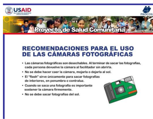
Figura 67. Recomendaciones para el uso de las cámaras fotográficas.