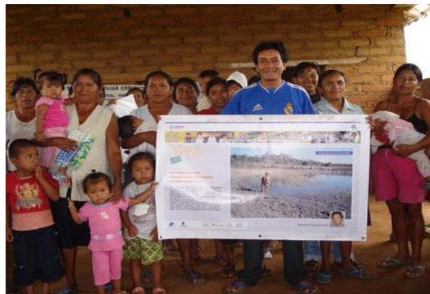
Figura 24. Representante de una de las comunidades de San Ignacio de Velasco, presentando el resultados de su participación en el autodiagnóstico a su comunidad.

Las fotografías seleccionadas para las exhibiciones municipales fueron también presentadas a nivel comunitario, en reuniones, asambleas, Comités de Análisis de la Información (CAI) o sesiones educativas, seleccionando algunas de ellas de acuerdo al objetivo de las diferentes actividades y su relación con el contexto o con la actividad específica. En este sentido, las exhibiciones tuvieron un carácter itinerante, con el propósito de compartir de la manera más amplia posible las múltiples y diversas miradas de las comunidades respecto a su situación de salud.