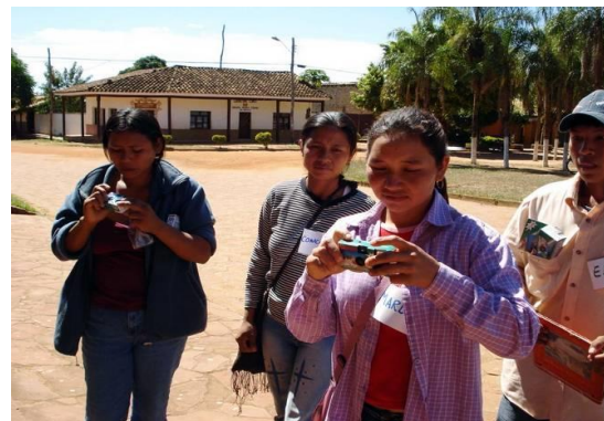
Figura 4. Participantes del Taller de Encuentro San Ignacio de Velasco, Santa Cruz.