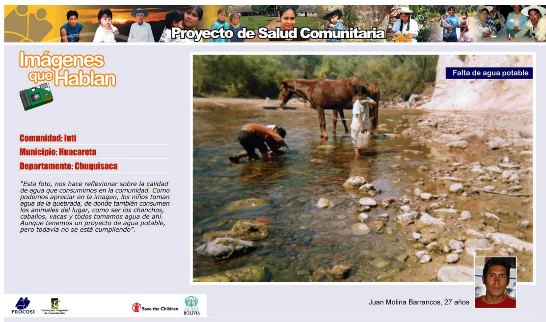
Figura 27. Una de las fotografías priorizadas sobre acceso y consumo de agua segura.

A continuación se presenta una pequeña selección de fotografías relacionadas a los principales temas priorizados por los y las participantes en orden de importancia.