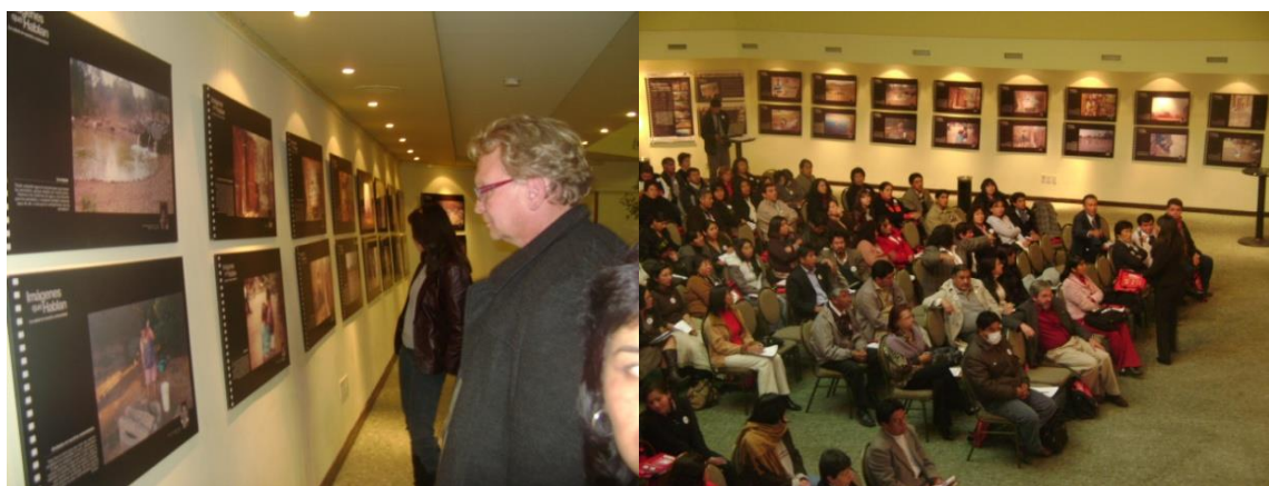
Figuras 52 y 53. Congreso Nacional de Bibliotecología. La Paz, julio de 2009.

Las Figuras 52 y 53 corresponden a la exhibición de las fotografías y testimonios, realizada con el propósito de sensibilizar a los representantes de las instituciones del Estado y de las organizaciones que trabajan en los centros de documentación y bibliotecas del país.