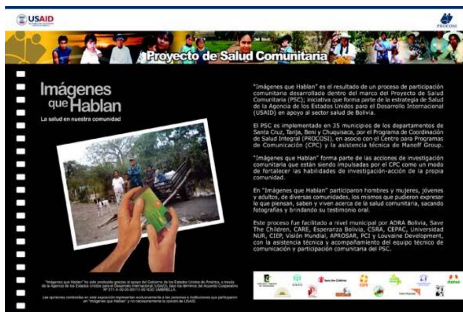
Figura 25. Diseño de la presentación de información general sobre las características Imágenes que Hablan para la exhibición departamental.

Para el efecto, se diseñaron las fotografías en otro tipo de formato, incluyendo también información general del proceso y el detalle de participantes cuyas fotos formaron parte de las exhibiciones. A continuación se presenta el diseño de dicha muestra fotográfica.