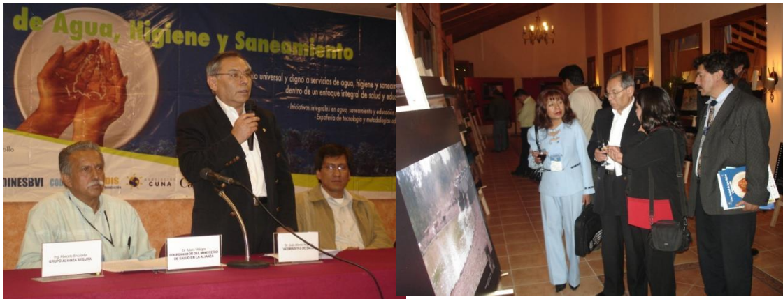
Figuras 48 y 49. Foro Nacional del Agua. Cochabamba, diciembre de 2008.

Las Figuras 48 y 49 corresponden a la presentación de los resultados del autodiagnóstico realizada con el propósito de sensibilizar a los representantes de las instituciones del Estado y de las organizaciones que trabajan con el tema de Agua, considerando que éste es la determinante de la salud más importantes, desde la mirada comunitaria.