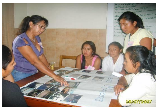
Figura 9. Taller de Reflexión – Diálogo Grupal San Ignacio de Velasco, Santa Cruz.

adultos y uno de mujeres adultas. Si en la experiencia han participado niños o niñas, se recomendó organizar un grupo especial para ellos o ellas . En cada grupo, cada uno de las y los participantes, compartió con todos los integrantes del mismo las razones por las que seleccionó sus tres fotografías y lo que significan para él o ella, en relación con la pregunta motivadora planteada inicialmente ¿Cómo ven la salud de las familias de su comunidad? .