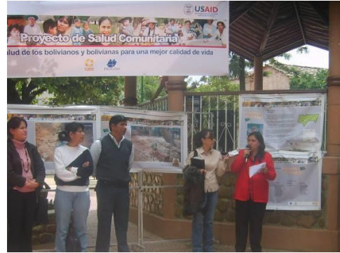
Figura 23. Exhibición municipal. Uriondo – Tarija

Las fotografías seleccionadas para las exhibiciones municipales fueron también presentadas a nivel comunitario, en reuniones, asambleas, Comités de Análisis de la Información (CAI) o sesiones educativas, seleccionando algunas de ellas de acuerdo al objetivo de las diferentes actividades y su relación con el contexto o con la actividad específica. En este sentido, las exhibiciones tuvieron un carácter itinerante, con el propósito de compartir de la manera más amplia posible las múltiples y diversas miradas de las comunidades respecto a su situación de salud.