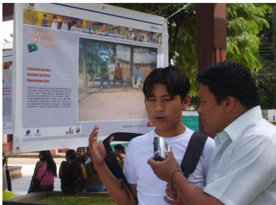
Figuras 60 y 61. Sondeo de opinión. Exhibición municipal Rurrenabaque, Beni.