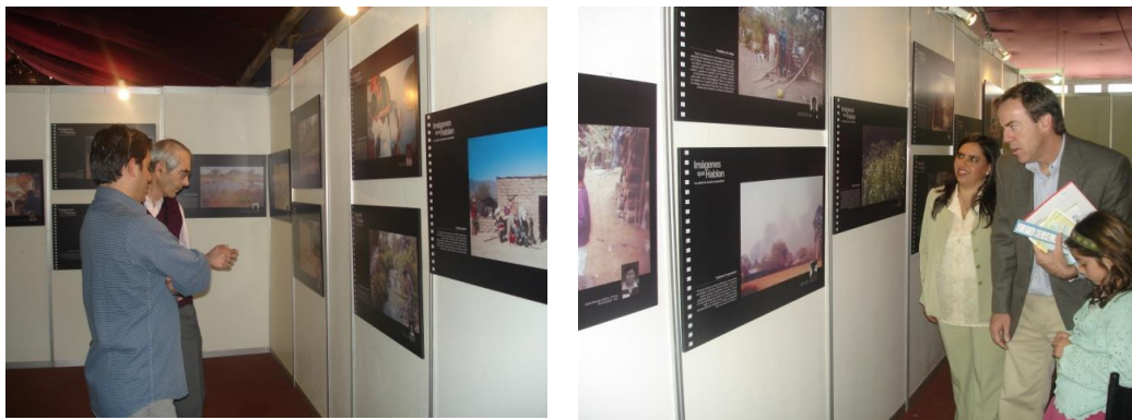
Figuras 44 y 45. Feria de Salud. La Paz, abril 2008.

Las Figuras 44 y 45 se refieren a la presentación de los resultados en el evento realizado en el Campo Ferial de Bajo Seguencoma, que contó con la participación de diferentes organizaciones nacionales e internacionales que trabajan en salud en el país y de estudiantes de las unidades educativas de la ciudad de La Paz.