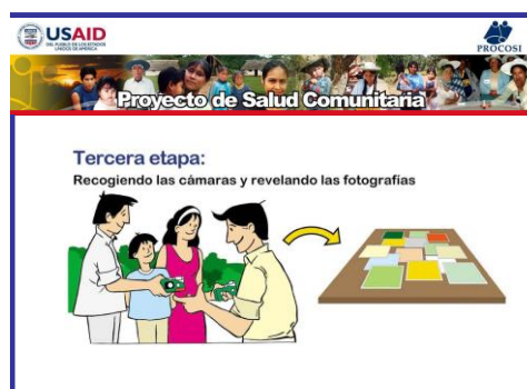
Figura 68. Tercera etapa: Recogiendo las cámaras y revelando las fotografías.