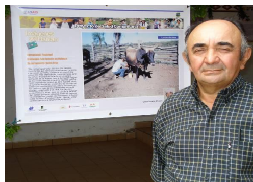
Figuras 18 y 19. Representantes de las comunidades cuyas fotografías fueron seleccionadas San Ignacio de Velasco – Santa Cruz

Las exhibiciones municipales organizadas contaron además con la participación de la población de los municipios porque fueron instaladas en las plazas o lugares de mayor concurrencia. En total se concretaron 30 exhibiciones de las fotografías a nivel municipal de las cuales a continuación se presentan algunas de ellas.