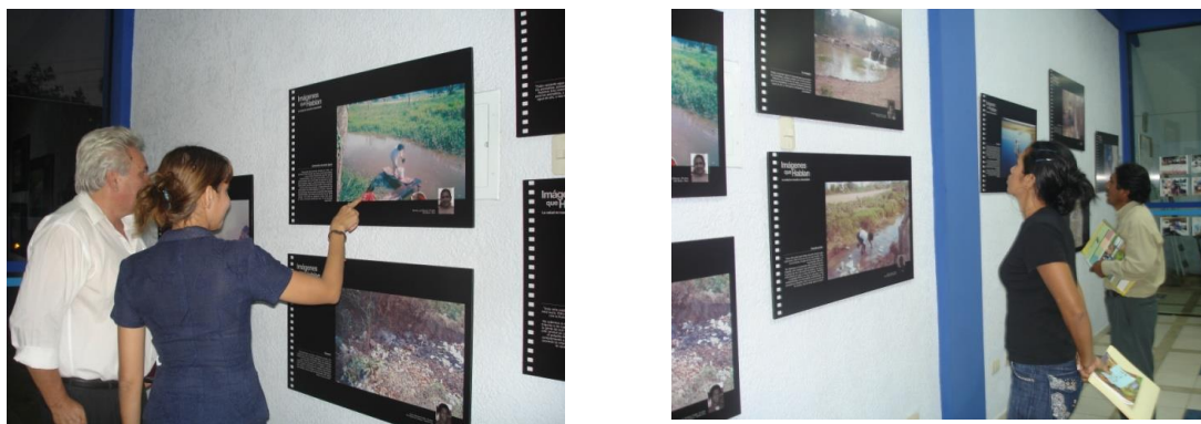
Figuras 46 y 47. Taller Nacional de Mitigación de Emergencias. Trinidad, Beni, julio 2008.

En las Figuras 46 y 47, se hace referencia a la exhibición de las fotografías y testimonios realizada con el propósito de sensibilizar a los representantes de las instituciones del Estado y de las organizaciones que trabajan en Gestión de Riesgos y temas de Agua, Higiene y Saneamiento.