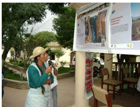
Figura 20. Exhibición municipal. Bermejo – Tarija

Las exhibiciones municipales organizadas contaron además con la participación de la población de los municipios porque fueron instaladas en las plazas o lugares de mayor concurrencia. En total se concretaron 30 exhibiciones de las fotografías a nivel municipal de las cuales a continuación se presentan algunas de ellas.