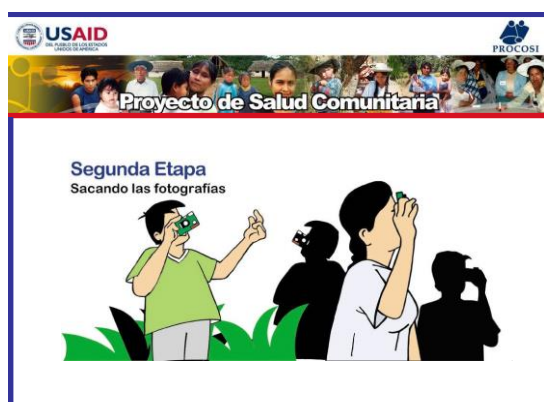
Figura 66. Segunda. Sacando las fotografías.

Tendrán que tomar en cuenta las siguientes recomendaciones realizadas en el Taller de Encuentro sobre el uso de las cámaras desechables: