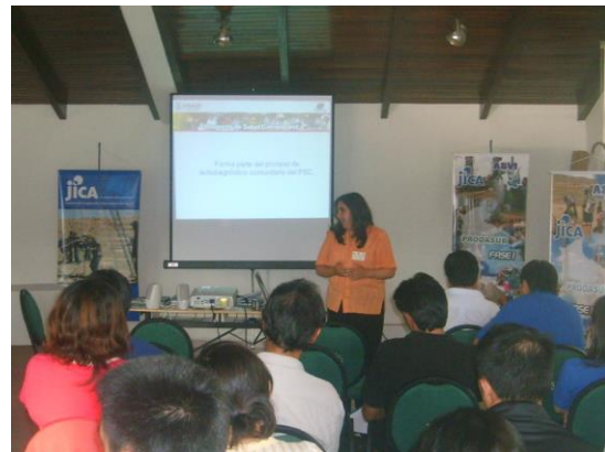
Figura 59. Socialización de la metodología a técnicos de la Agencia de Cooperación JICA.