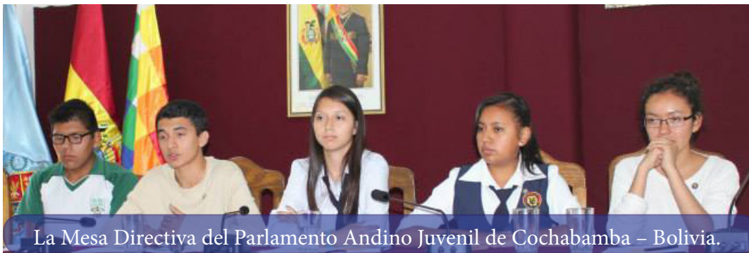
La Mesa Directiva del Parlamento Andino Juvenil de Cochabamba – Bolivia.

Los Certificados y Credenciales que acreditan a los estudiantes de los Colegios: Alemán Santa María, Santo Domingo Savio, Nacional Calama, San Agustín y Maryknoll como Parlamentarios Andinos Juveniles fueron también entregados durante el acto de premiación a los 25 estudiantes de Educación Secundaria, que durante el ejercicio académico replicaron el modelo del Parlamento Andino y elaboraron cinco documentos-ponencias con propuestas para mejorar la calidad de vida de los ciudadanos de la Región Andina.