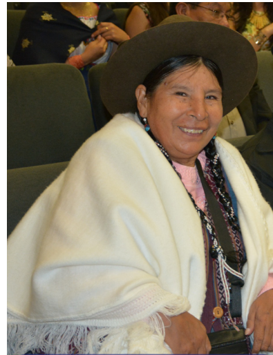
La Parlamentaria Hilaria Supa Huamán, ponente de la Decisión.

Con la cual el Parlamento Andino pretende mediante esta propuesta reconocer, proteger y articular los derechos de las comunidades y su conocimientos ancestrales en la Región Andina, impulsar el diseño e implementación de políticas que contemplen el rescate y la aplicación de conocimientos tradicionales en la adaptación y mitigación del cambio climático, así como elaborar un proyecto de Norma Regional para la protección de los conocimientos, innovaciones y prácticas tradicionales de las comunidades indígenas, afrodescendientes, locales o sus formas organizativas equivalentes en los respectivos países.