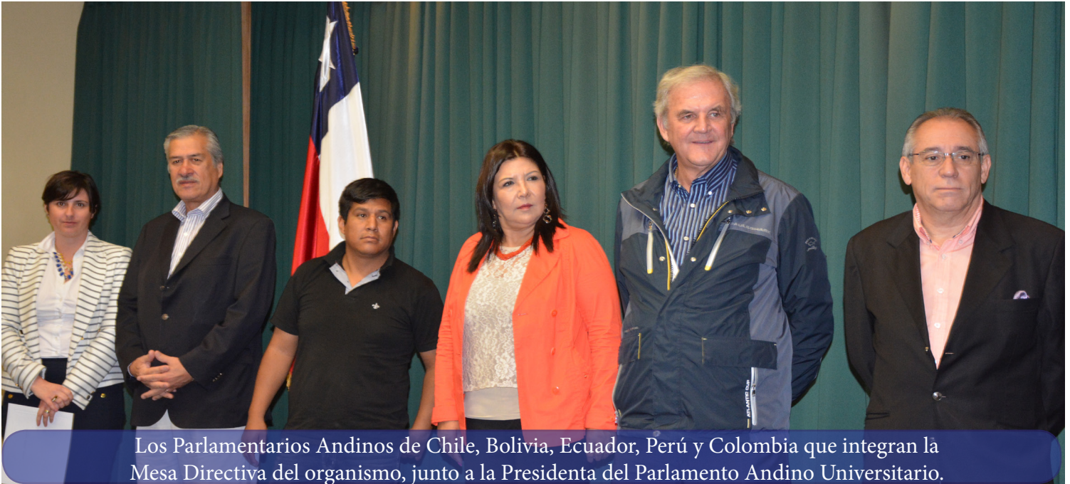
Los Parlamentarios Andinos de Chile, Bolivia, Ecuador, Perú y Colombia que integran la Mesa Directiva del organismo, junto a la Presidenta del Parlamento Andino Universitario.

El pasado 28 de noviembre, en el marco del XLV Período Ordinario de Sesiones se llevó a cabo la instalación de la segunda versión del Parlamento Andino Universitario en Valparaíso – Chile, ejercicio académico que replica el modelo del Parlamento Andino e involucra a estudiantes de distintas carreras profesionales, en esta oportunidad a jóvenes de la Universidad Técnica Federico Santa María (USM), con el fin de construir propuestas que aporten posibles soluciones a los problemas sociales de la Región Andina.