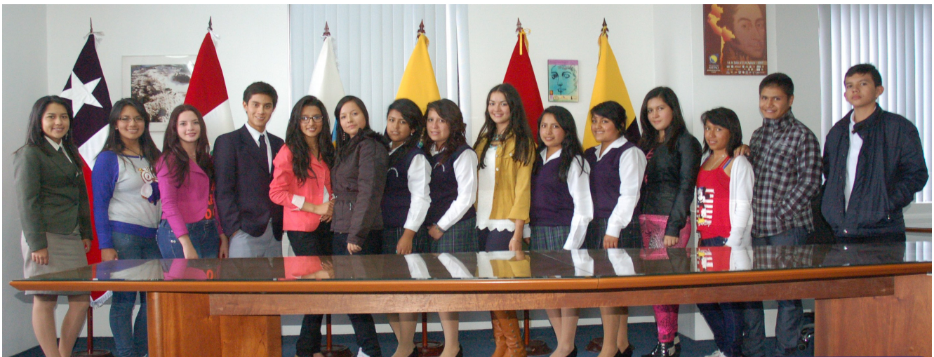
Los Parlamentarios Juveniles de Ibagué (Colombia) e Ibarra (Ecuador) intercambiaron puntos de vista y propuestas para resolver problemas comunes en la Región Andina.

Los cinco estudiantes de instituciones públicas, quienes integran la Comisión Segunda de Educación, Ciencia, Tecnología y Comunicación, replicando el modelo del Parlamento Andino, fueron premiados el pasado 11 de septiembre por elaborar la mejor ponencia (Educación, primer paso para una Ibagué mejor) entre los 25 Parlamentarios con un viaje a la capital ecuatoriana.