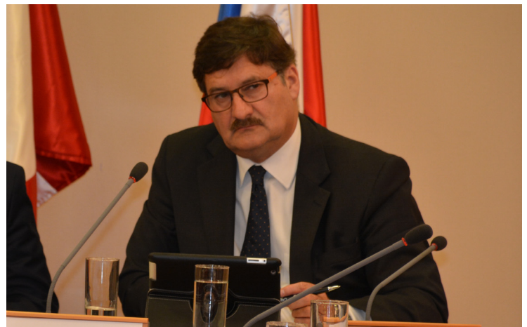
El Diputado de Chile, Ramón Farías.

Además, el Subsecretario chileno advirtió que se deben generar políticas públicas comunes para generar una integración real, con el propósito que la población migrante pueda ser beneficiada, por ejemplo, con la eliminación del roaming entre Chile y Argentina, así como garantizar un acceso a tecnologías que les permitan mantener su identidad, la comunicación con sus familias.