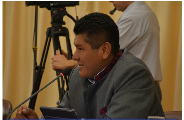
El Vicepresidente de la Comisión Primera y Parlamentario Andino por Bolivia, Fidel Surco Cañasaca.

Por su parte, el Parlamentario Andino por Bolivia, Senador Fidel Surco Cañasaca , expresó su voluntad de compartir como Estado algunos criterios y experiencias en el abordaje de la Movilidad, como la aprobación de la Ley 370, que integra a la Constitución Política de su país, las disposiciones en materia migratoria de ACNUR (Alto Comisionado de las Naciones Unidas para los Refugiados).