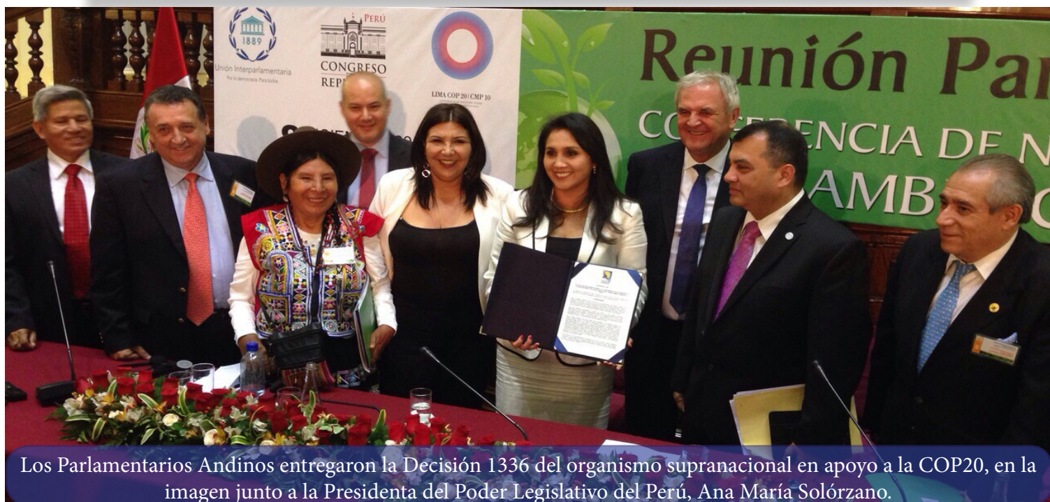
Los Parlamentarios Andinos entregaron la Decisión 1336 del organismo supranacional en apoyo a la COP20, en la imagen junto a la Presidenta del Poder Legislativo del Perú, Ana María Solórzano.

L a Mesa Directiva e integrantes de la Comisión Tercera de Seguridad Regional y Desarrollo Sostenible del Parlamento Andino participaron el pasado 9 de diciembre en la Reunión Parlamentaria Conferencia de Naciones Unidas sobre Cambio Climático que se realizó en Lima (Perú), en la cual presentaron la Decisión 1336 aprobada por el organismo: ‘el Apoyo del Parlamento Andino a la Conferencia de las partes de la Convención Marco de las Naciones Unidas sobre cambio climático- COP20’.