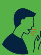
Tos y/o estornudos