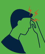
Dolor de cabeza y malestar general