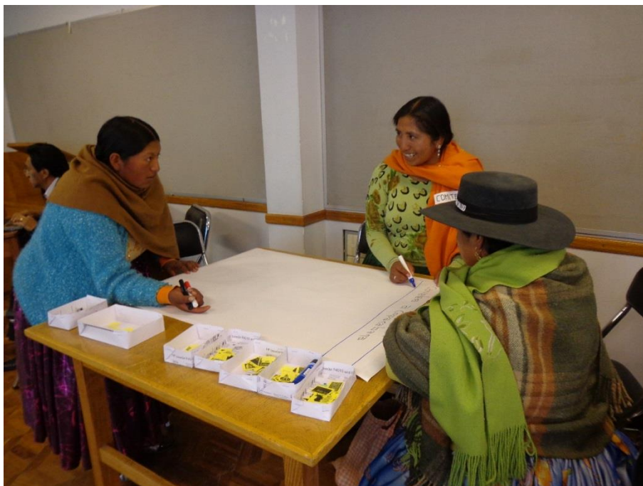
Lideresas del Área Rural, elaboran el Mapa Parlante de su distrito municipal.