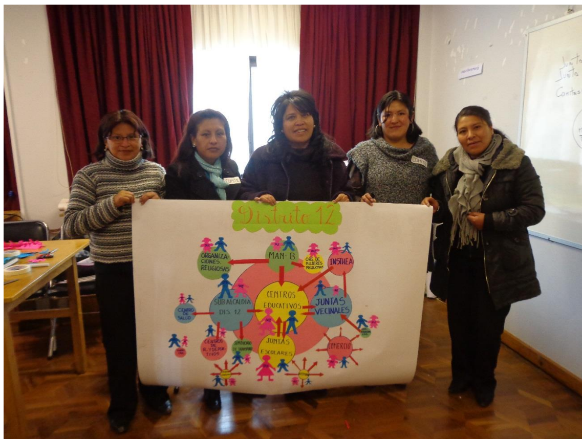
Comités Operativos del Distrito 12 presentan el Diagrama de Venn