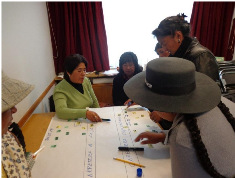
Elaboración de Mapa Parlante por Lideresas del Distrito 7