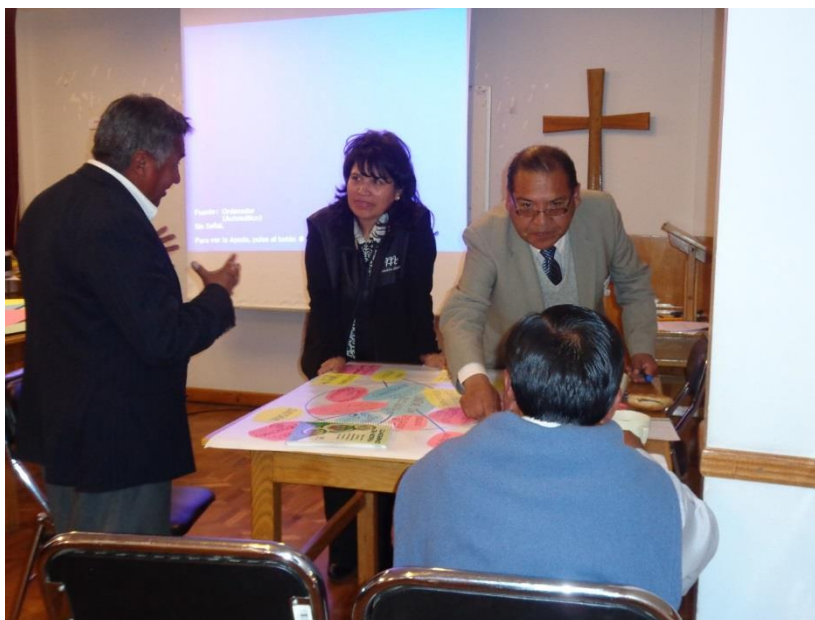
Miembros de Comités Operativos, elaborando el Diagrama de Venn