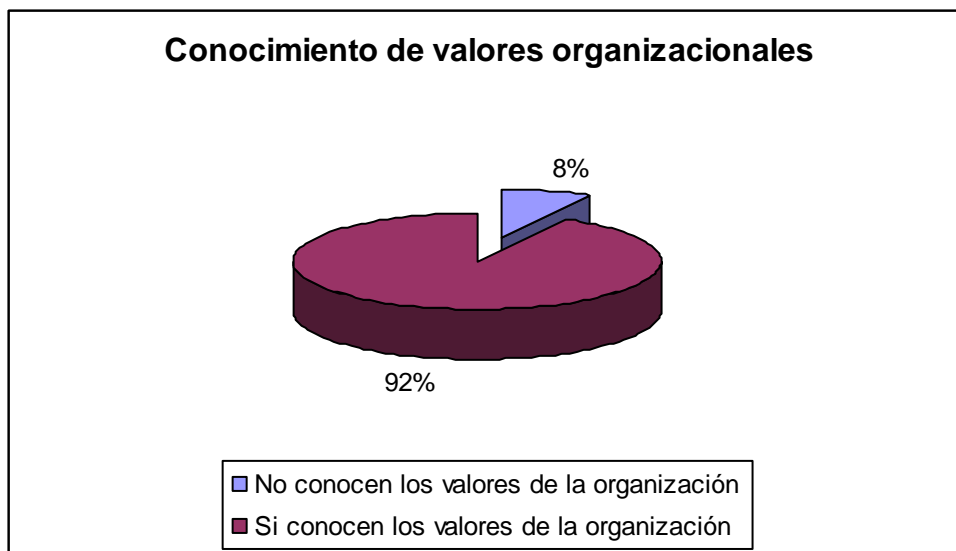
Gráfico No.1 Conocimiento de valores organizacionales

Los valores finales son valores generales que, en este caso, son dictados por la organización a nivel internacional y se constituyen en las líneas generales entre las cuales se construyen acciones encaminadas a lograr la visión y misión de la organización.